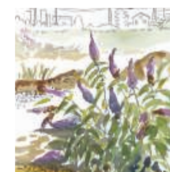
Arbre aux papillons