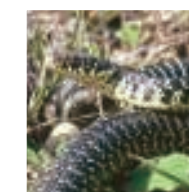
Couleuvre verte et jaune